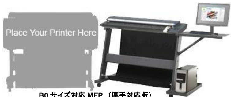
B0 サイズ対応 MFP (厚手対応版)

※上記、写真内のパソコン、モニター、キーボード、マウス、プリンター等は MFP セットには含まれません。別途ご用意ください。