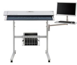
SC シリーズ 専用ユニバーサルスタンド