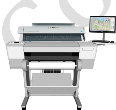
A1/A0/B0 サイズ対応 MFP

※MFP システムのアップグレード価格は各スキャナ「導入後アップグレード価格表」の金額と同様です。