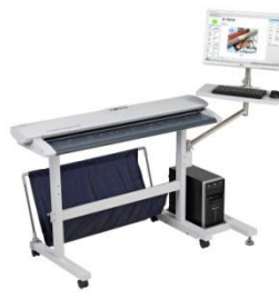
SC スタンド+PC/モニタ搭載キット