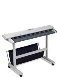
SC スタンド(付属:原稿受けバスケット)